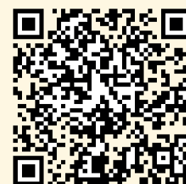
Illustration : © Denis Carrier

GRENOBLE - Centre des Congrès WTC Infos et inscriptions : 04 76 62 28 18